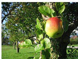
Sadne in zelenjavne posebnosti